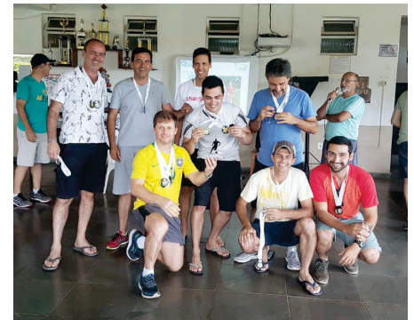
Turma da sinuca