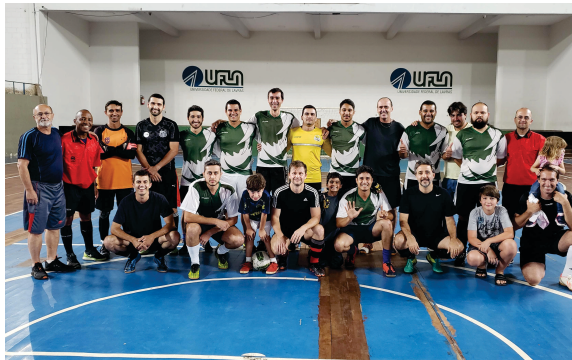
Atletas do Futsal

No tênis de mesa, Matheus Pugina (DQI) foi o